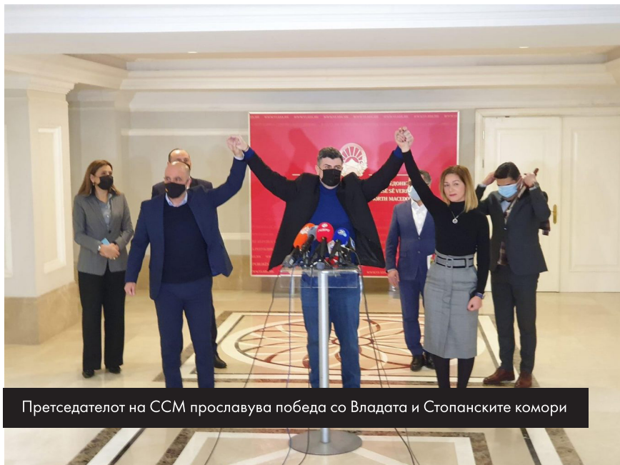
Претседателот на ССМ прославува победа со Владата и Стопанските комори

населението се вртоглаво зголемени за овие 5 години, не поради луксузирање туку за осигурање на домување, или за жал, лекување. Локалните избори во 2021 година каде ВМРО-ДПМНЕ победи условно сепак според апсолутниот број на гласови е најнизок број на гласови за оваа партија и тие можат да се сметаат за колатерален победник поради ниската излезност и трансфер на традиционалните гласачи на СДСМ кон независните опции или апстиненцијата која беше рекордно висока.