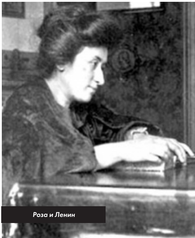
Роза и Ленин